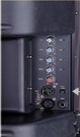
בורר הכניסה Mic / Line